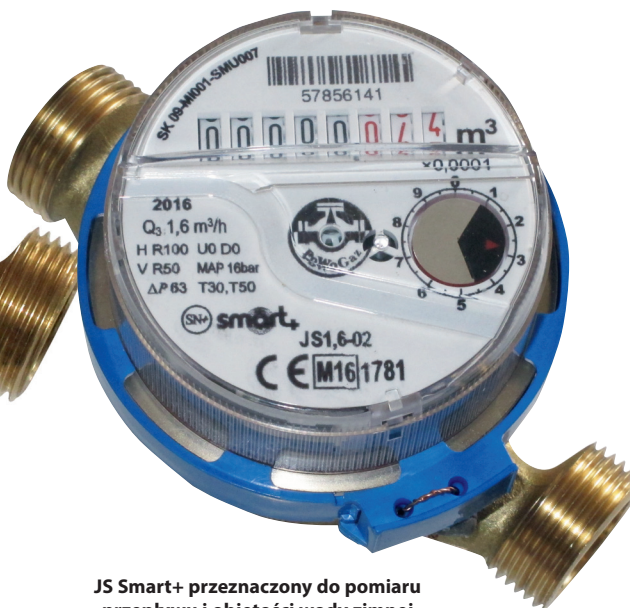
JS Smart+ przeznaczony do pomiaru przepływu i objętości wody zimnej

JS Smart+ to wodomierz, który od lat jest pierwszym wyborem klientów w naszym kraju. Inżynierowie poznańskiej spółki Apator Powogaz S.A. opracowali model, który spełnia wymagania wytrzymałościowe i MID, przystosowany jest do odczytów typu drive-by i jednocześnie zachowuje bardzo korzystną cenę. Warto przyjrzeć się mu bliżej.